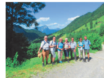
Wanderung ins Kaisertal bei Kufstein