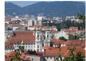
Vereinsausflug Graz 2010