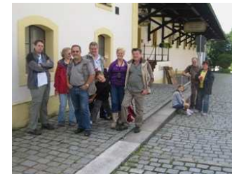
Wanderung von Aidenbach nach Aldersbach