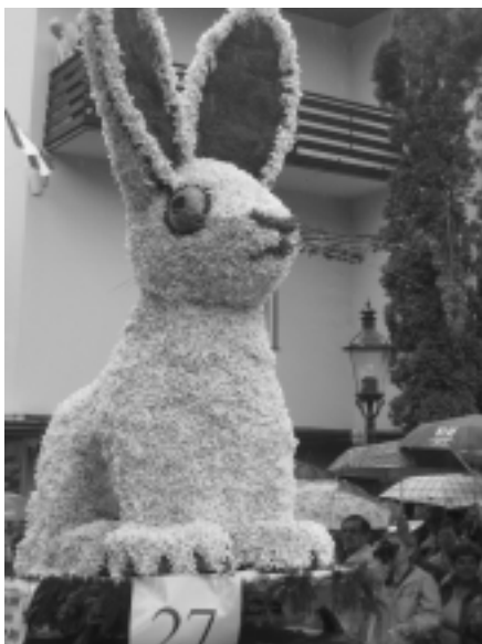
Narzissenfest Bad Aussee 2006