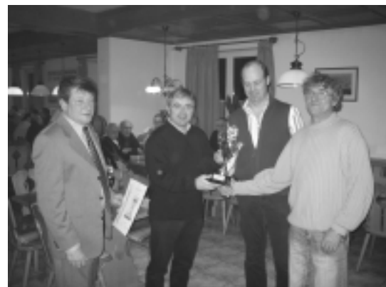
Siegerehrung - Jahreshauptversammlung 2006